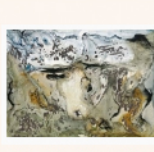
Helga Kreuzritter-Taurus-Aluminium Painting-60x80