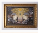
Natalja Nouri-Suil-charcoal, pencil, ink, acrylic, oil-100x70