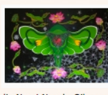
Natalja Nouri-Nuesh. Oil on canvas. 100x70cm